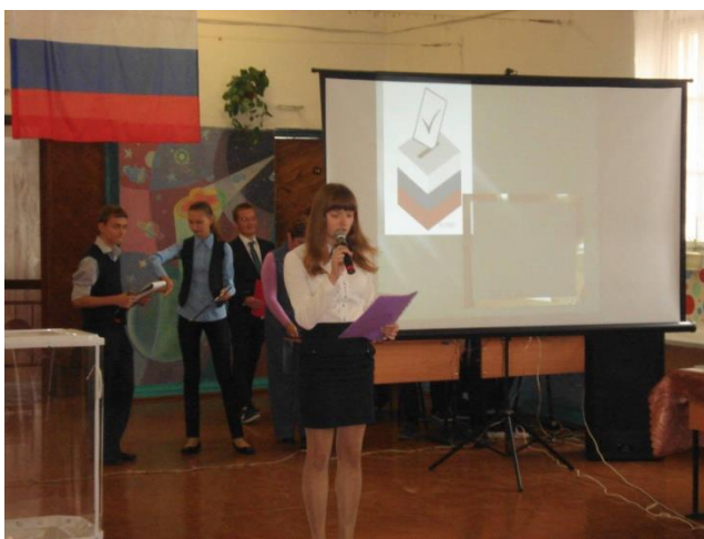
Выборы Президента ученического самоуправления

14 сентября в Российской Федерации прошли выборные кампании различного уровня. В Тульской области проходили выборы в областную думу. Учащиеся нашей школы вместе с родителями приняли самое активное участие в голосовании. Родители отдали свой голос, а учащиеся написали мини-сочинения "Я на выборы иду". Президентский совет старшеклассников провёл среди обучающихся 9-11 классов и педагогов школы экспресс-интервью «Моя гражданская позиция»